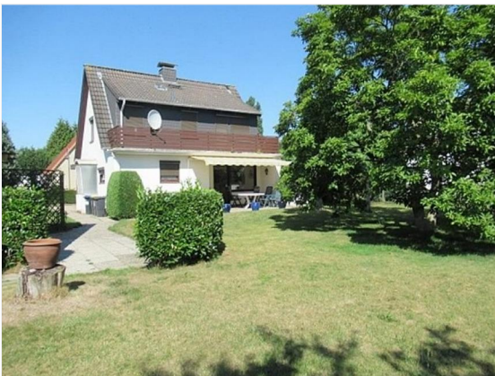
Hausansicht vom Garten